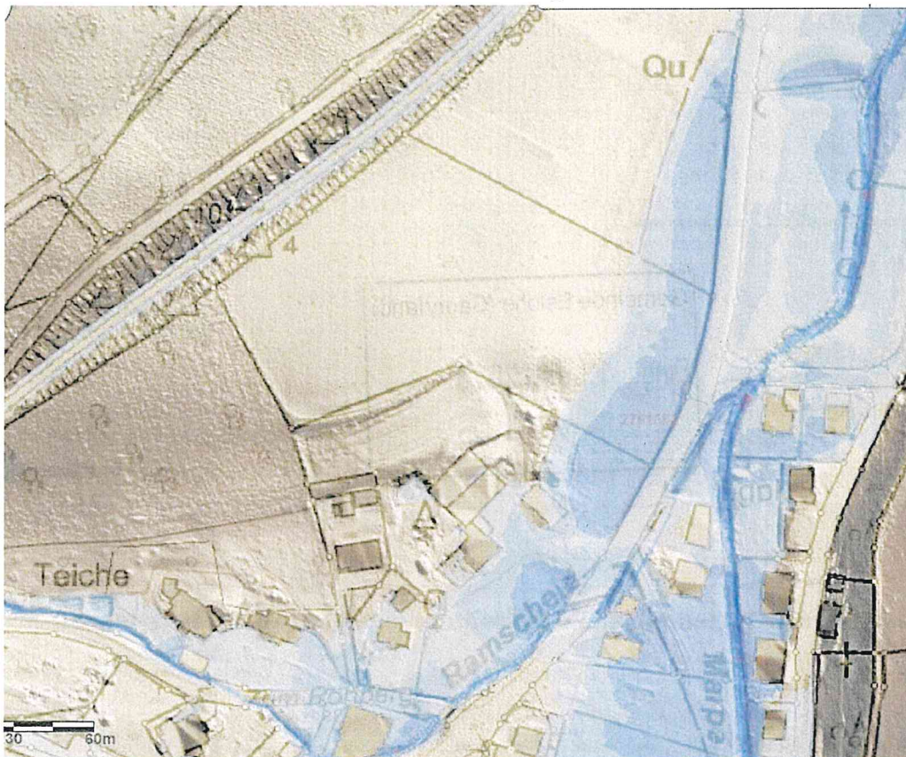
Abbildung 1: Starkregengefahrenhinweiskarte NRW – Überflutungstiefen 100-jährliches Ereignis